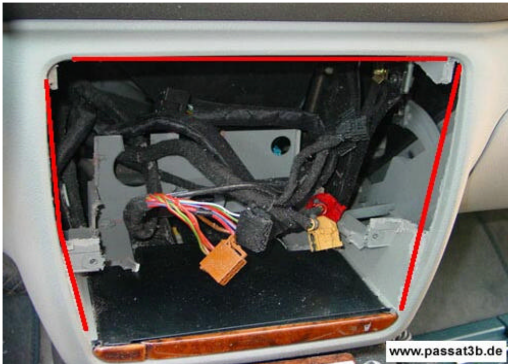
Bild 8 So soll es am Ende dann aussehen